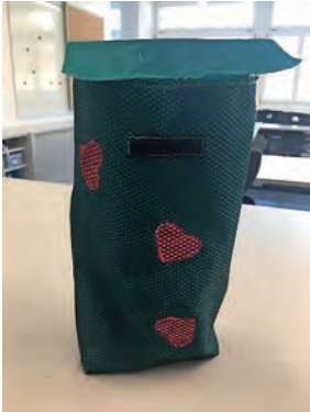
Meret Behälter aus Rucksacknylon, überzogen mit einem Netz. Die kleinen Herzen darin sind aus gefalteten Schoggipapierli gestaltet.