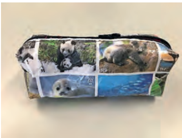
Annika Die Aussenseite wurde mit Migros-Sammelbildchen gestaltet.