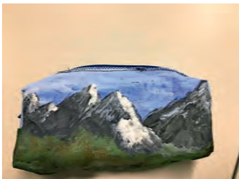
Tabea Ein altes Leintuch wurde kunstvoll bemalt.