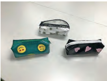
Dijana Serie mit Blachen und Blachenresten.