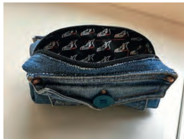
Jonas Aussen Jeans, innen ein alter Sportbag. Die Jeans- tasche wurde mit einem Knopf verziert.