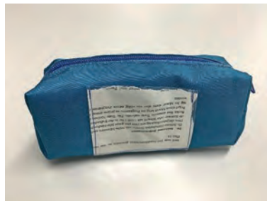
Anika Etui aus Rucksacknylon; die Aussentasche wurde mit einer Buchseite verziert.