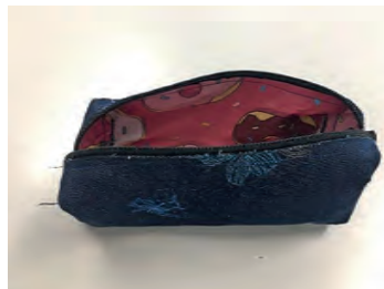
Lukas Aussen Jeans, innen eine ausgediente Einkaufstasche.